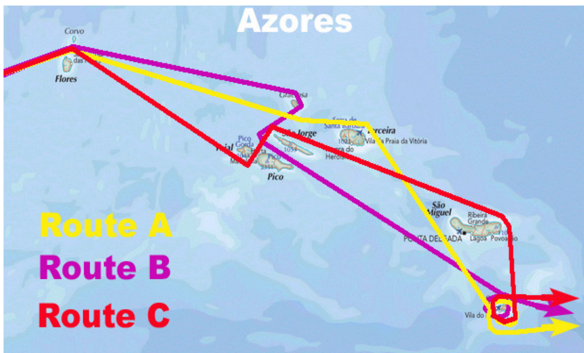
As três opções da rota entre as ilhas. Cada piloto tem de decidir ao sair do canal Flores-Corvo, que sentido navegar.

Mantendo o espírito de aventura contra os elementos da natureza, o curso é intencionalmente pensado para não favorecer só um tipo de barco. O piloto é forçado a optar por um dos três cursos que o levam em zig-zag entre as 9 ilhas dos Açores, começando pelo canal das Flores-Corvo e acabando com a volta a Santa Maria.